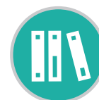
Cuadro de planificación del programa

Usted puede comenzar por pensar acerca de su audiencia, lo cual corresponde a la sección uno de la guía de herramientas. Sin embargo, no tiene que comenzar ahí. Por ejemplo, si recibe una invitación para hacer una presentación sobre el cáncer de seno, quizá ya conozca el lugar donde se hará la presentación antes de saber algo sobre su audiencia.